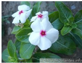
Pervenche de Madagascar