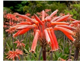
Aloe saponaria en fleurs